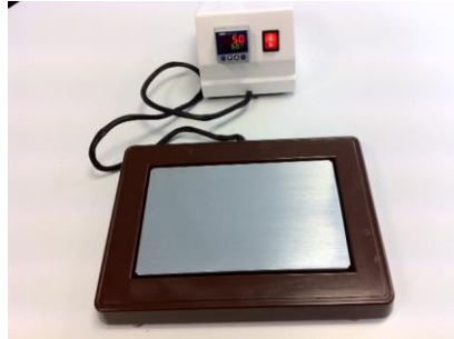
PC 25 X 16