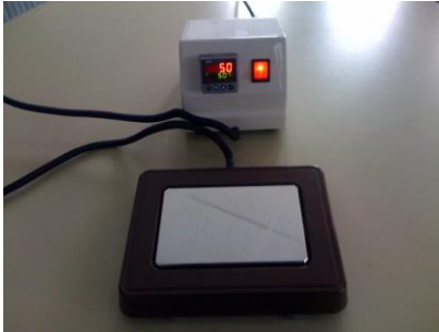
PC 16,5 X 11