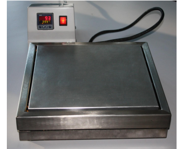
PC 30 X 30